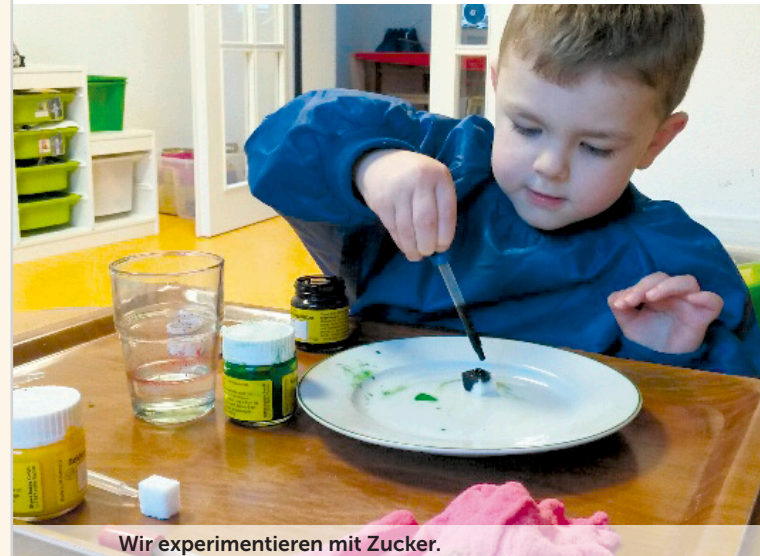
Wir experimentieren mit Zucker.

Unsere Köchin kocht täglich aus saisonalen und regionalen Zutaten frisches Mittagessen in unserer eigenen Küche.