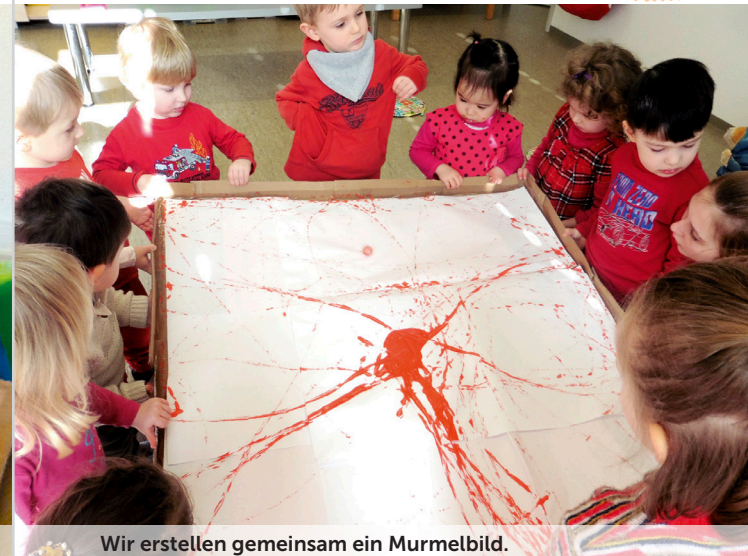
Wir erstellen gemeinsam ein Murrebild.

Wir geben den Kindern Zeit, das Gelernte selbst auszuprobieren .