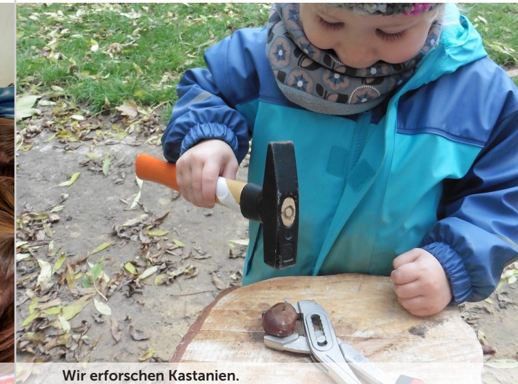
Wir erforschen Kastanien.

Durch dieses »sich Fragen stellen« lernen die Kinder scheinbar alltägliche Phänomene intensiver zu betrachten, wahrzunehmen oder zu erfüllen. Sie erfahren anschaulich, dass ihnen diese Fragen gezielt helfen können, sich in ihrer Welt besser zurecht zu finden und spannende Dinge zu entdecken.