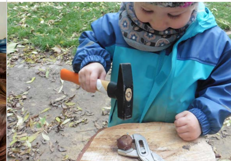
Wir erforschen Kastanien.

Durch dieses »sich Fragen stellen« lernen die Kinder scheinbar alltägliche Phänomene intensiver zu betrachten, wahrzunehmen oder zu erfüllen. Sie erfahren anschaulich, dass ihnen diese Fragen gezielt helfen können, sich in ihrer Welt besser zurecht zu finden und spannende Dinge zu entdecken.