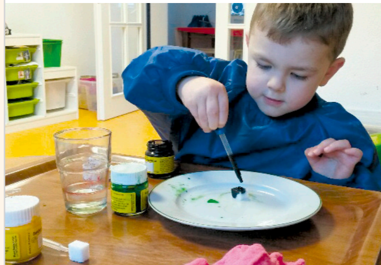
Wir experimentieren mit Zucker.

Unsere Köchin kocht täglich frisches Mittagessen.