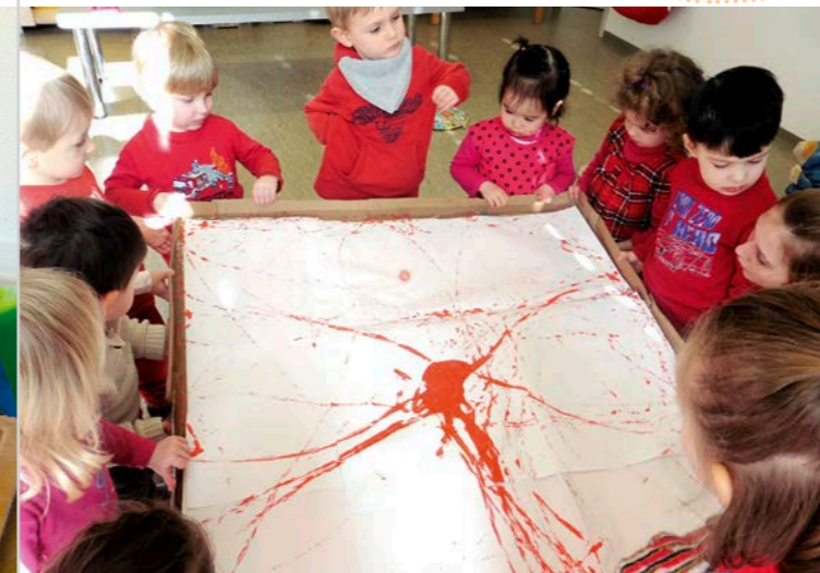
Wir erstellen gemeinsam ein Murrelmalbild.

Wir geben den Kindern Zeit, das Gelernte selbst auszuprobieren.